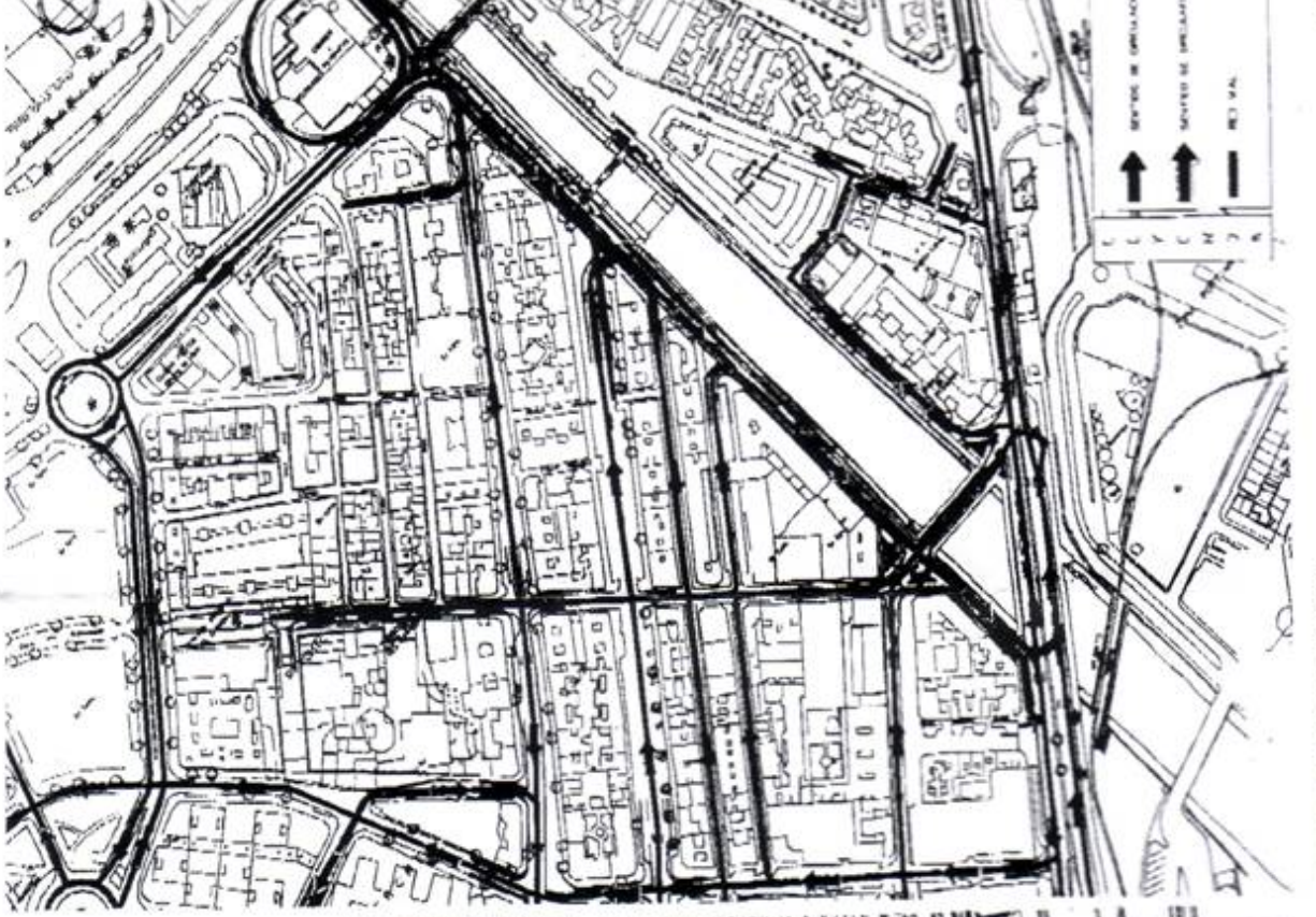
8. SITUACIÓN ACTUAL

04-07 17:06 952135420 GABINETE ALCALDI->0954214497 BCM PAG. 06