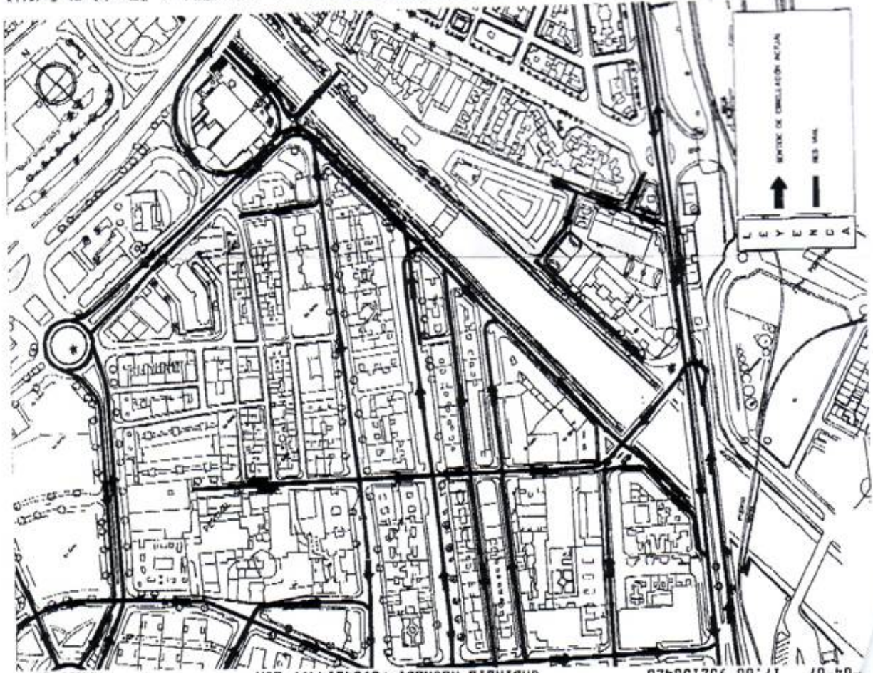
7. SITUACIÓN PREVIA